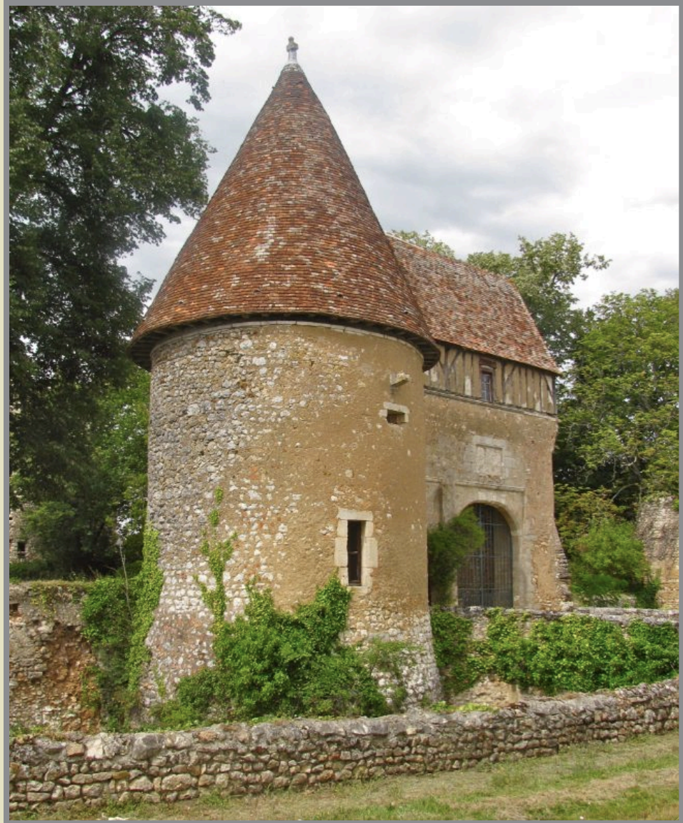
Le Château, vu depuis son parc... et son entrée monumentale.