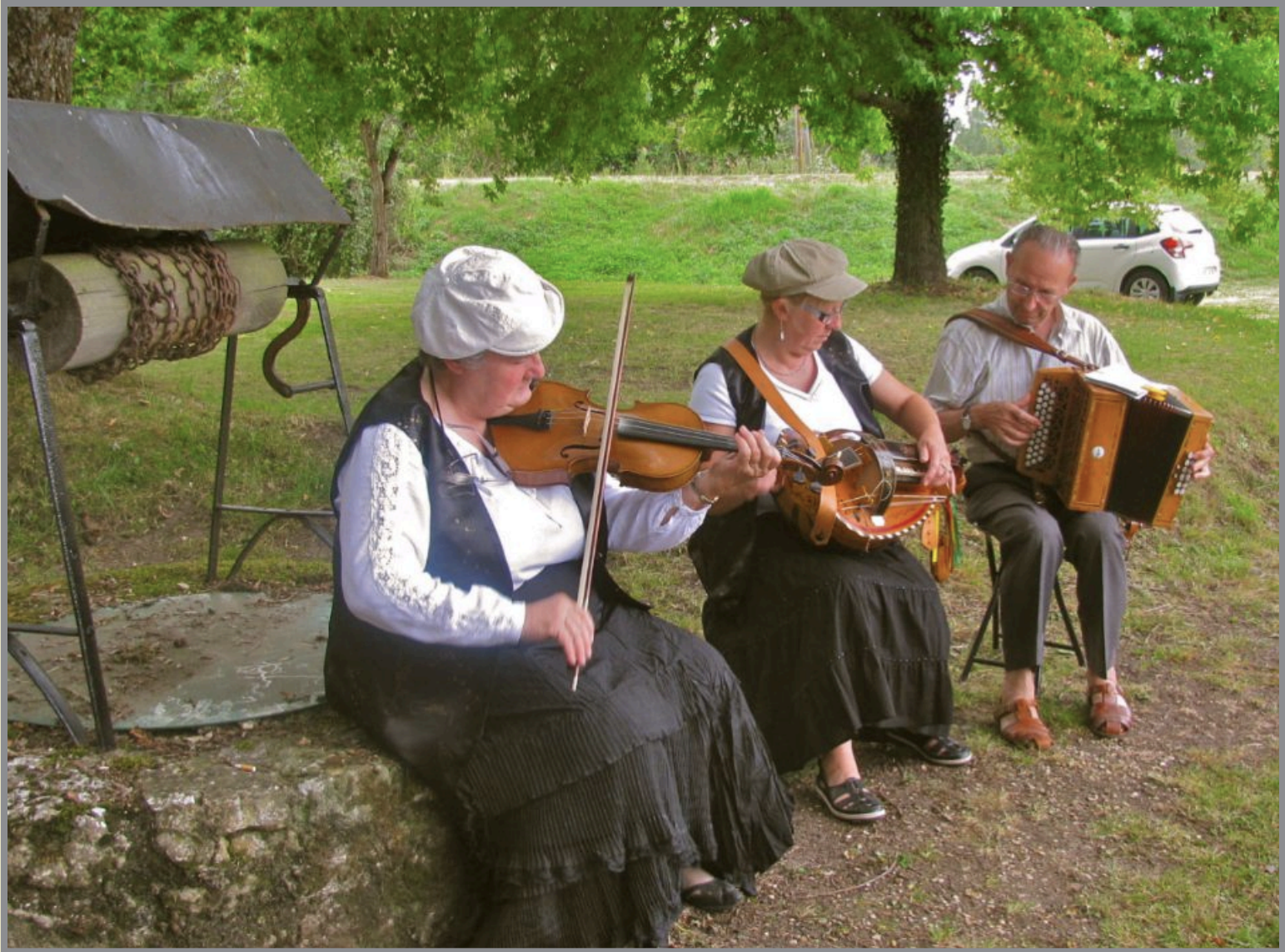
Les musiciens devant le puits de la Maladrerie.