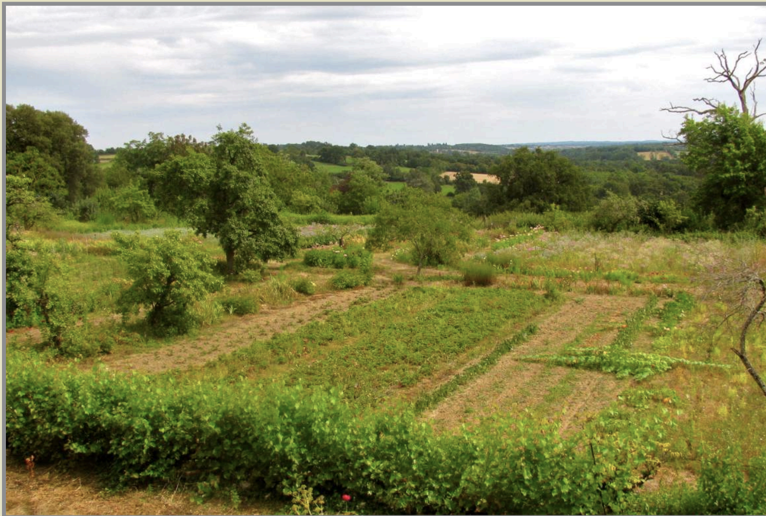
Le potager du Château.