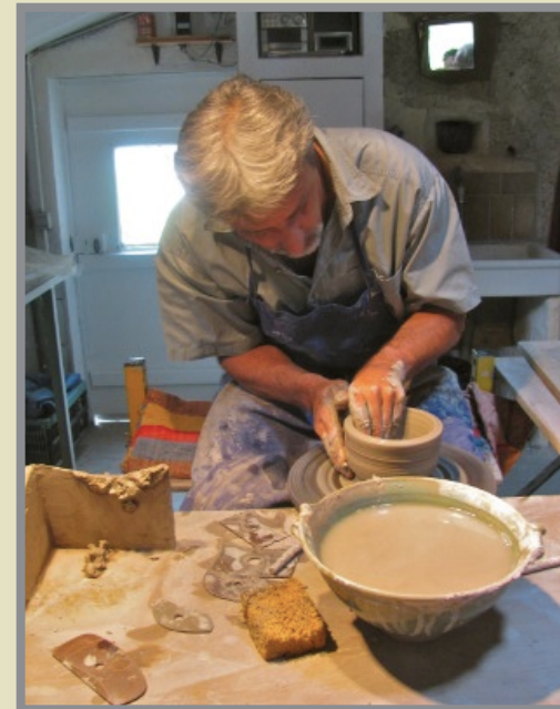
Réalisation d'un saladier.