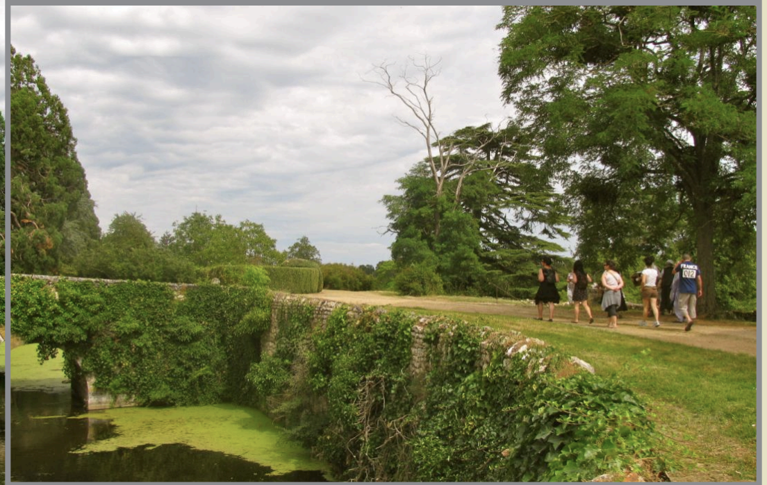
L'entrée monumentale et le pont d'accès en pierre qui enjambe les douves.