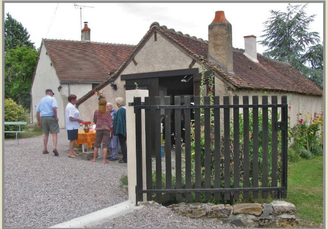
Arrivée à la maison et à l'atelier du potier.