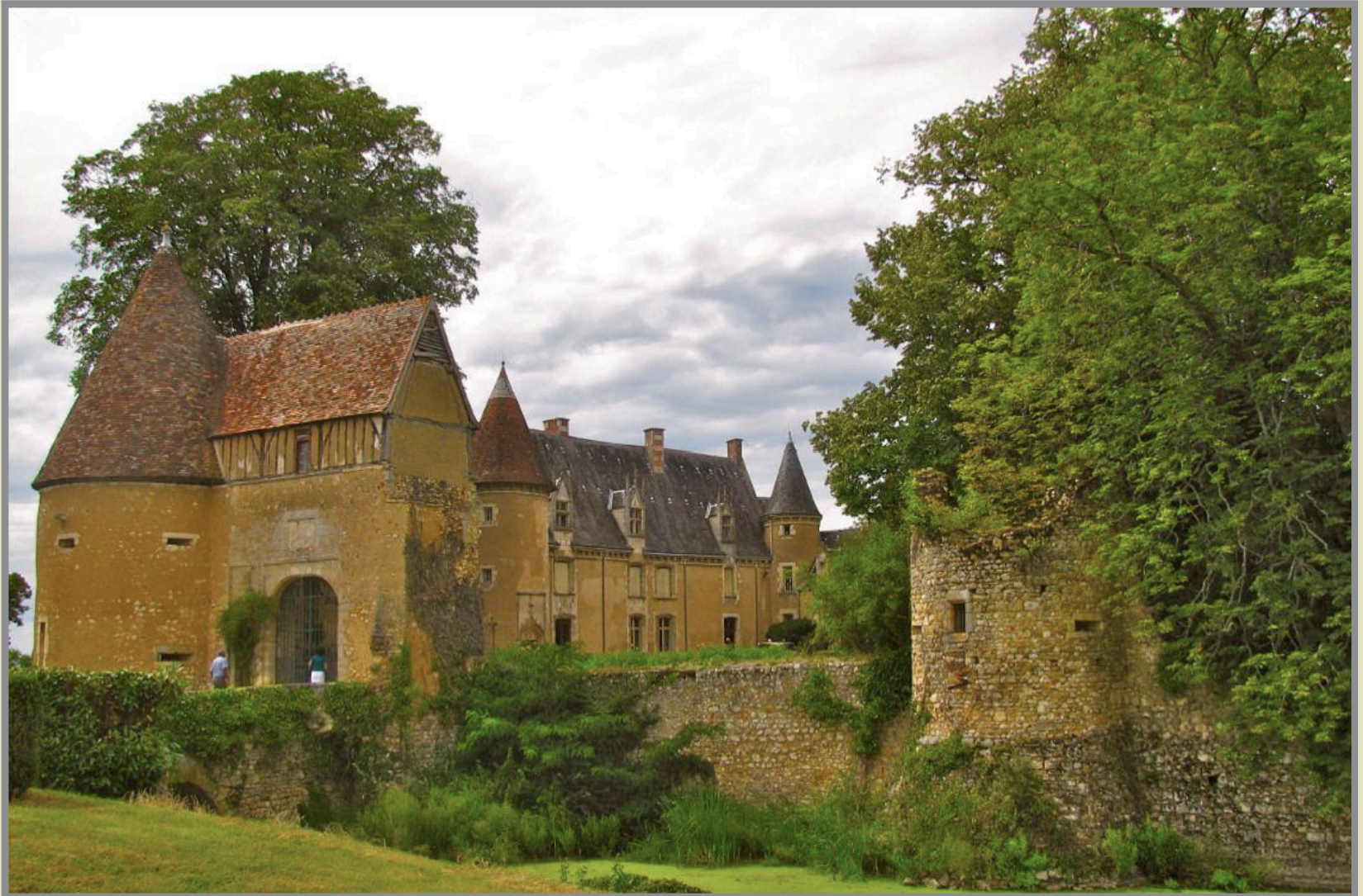
Le Château, côté cour. A droite, une des tours défensives restant du Moyen-âge : le château en a eu 11.