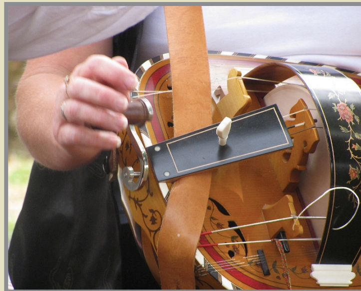
Les trois musiciens et le détail de la vielle.