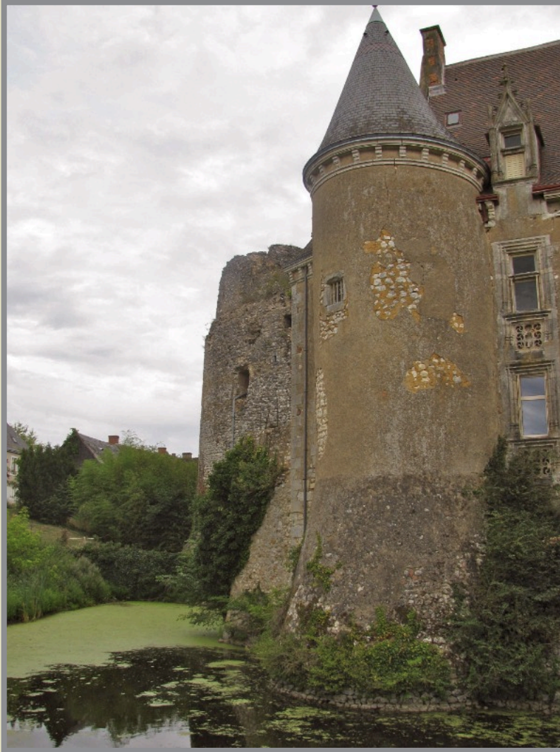
Le Château, et sa partie moyenâgeuse à gauche...