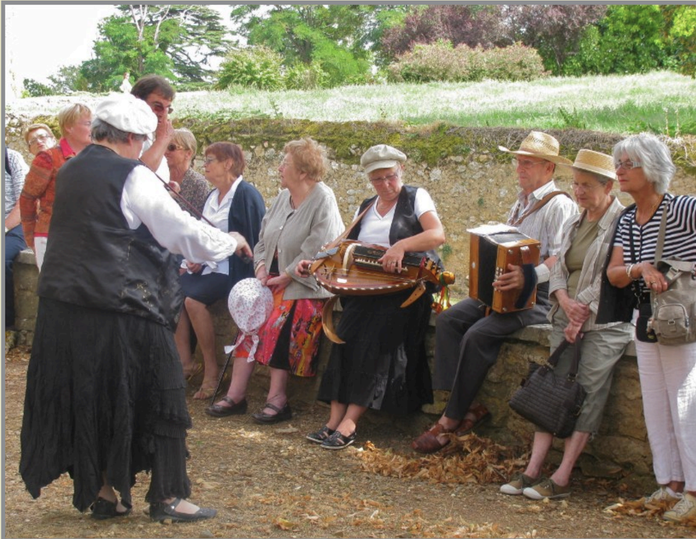
Debout, juste derrière la violoniste : monsieur le maire donnant quelques explications sur son village.