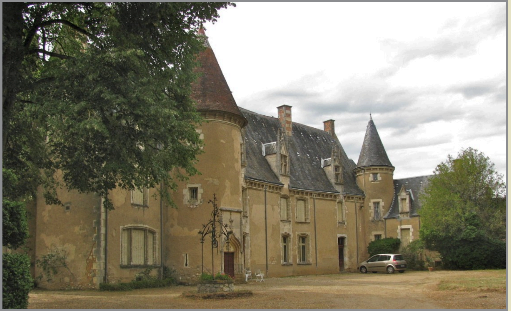
La cour intérieure du château, vue depuis la porte d'entrée.