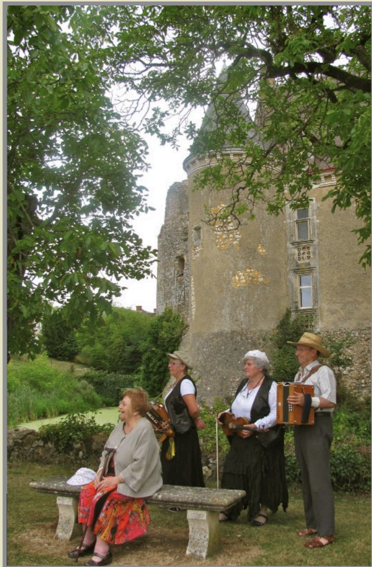
A nouveau, aubade devant le château entouré d'arbres centenaires.