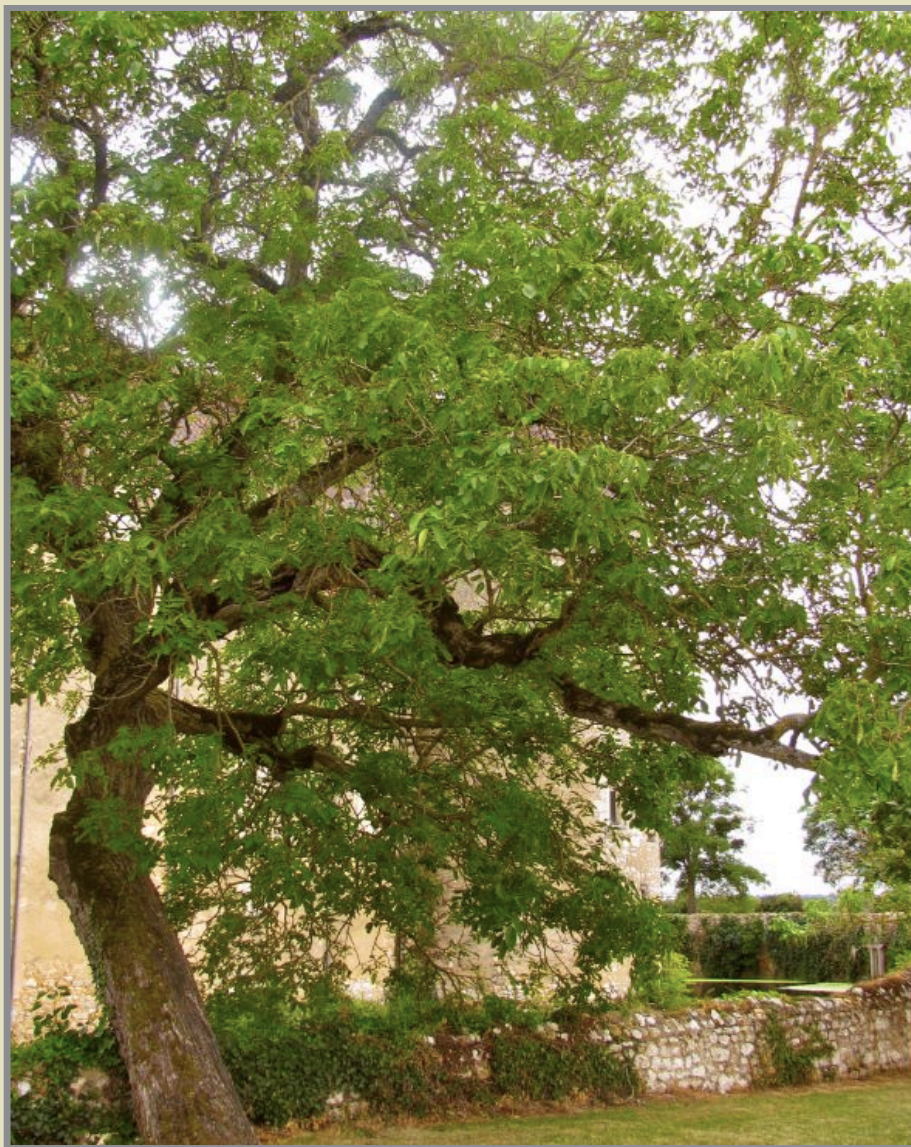
L'arbre magnifique fait la révérence !