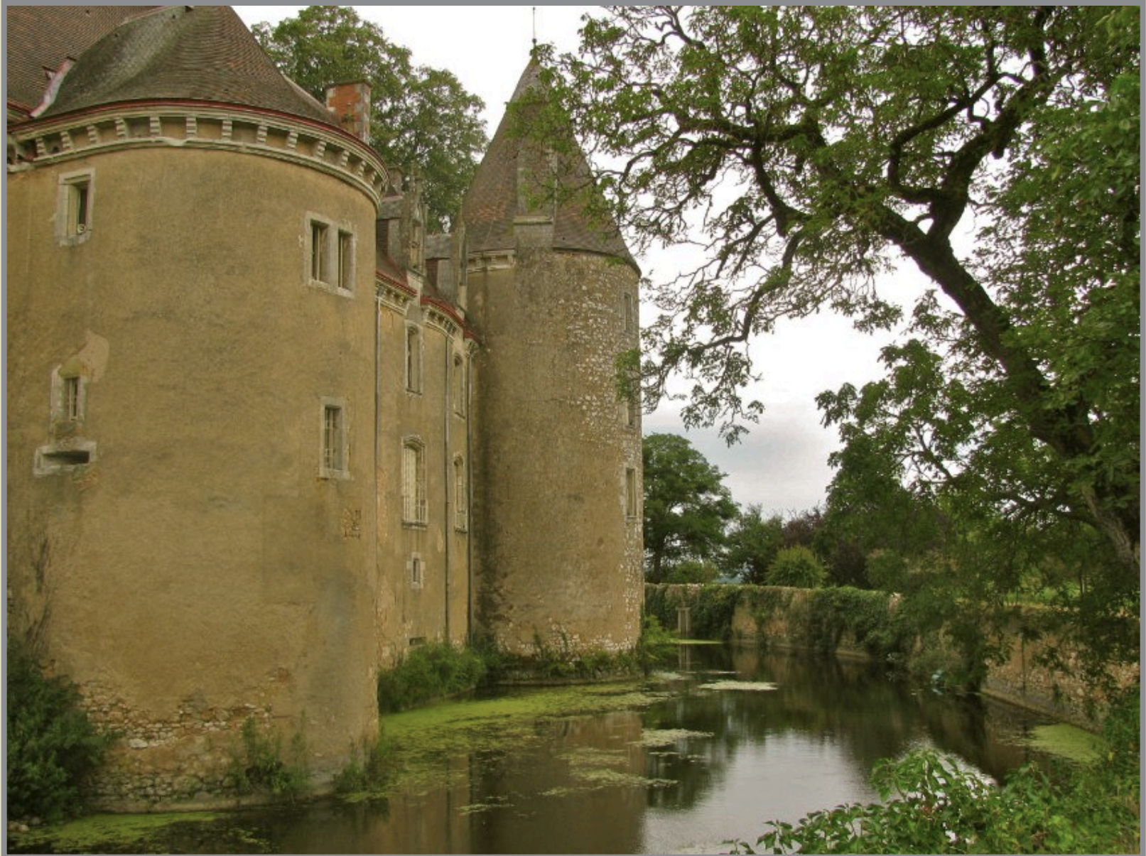
Des douves imposantes.