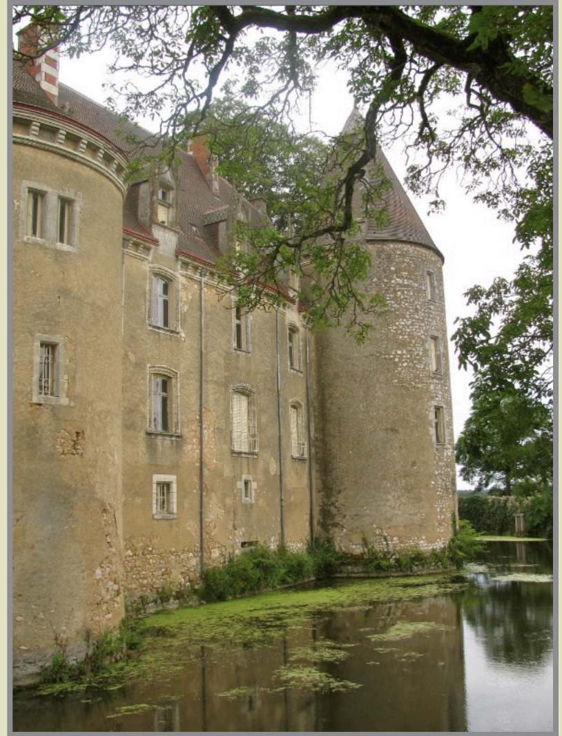
...et sa partie plus récente.