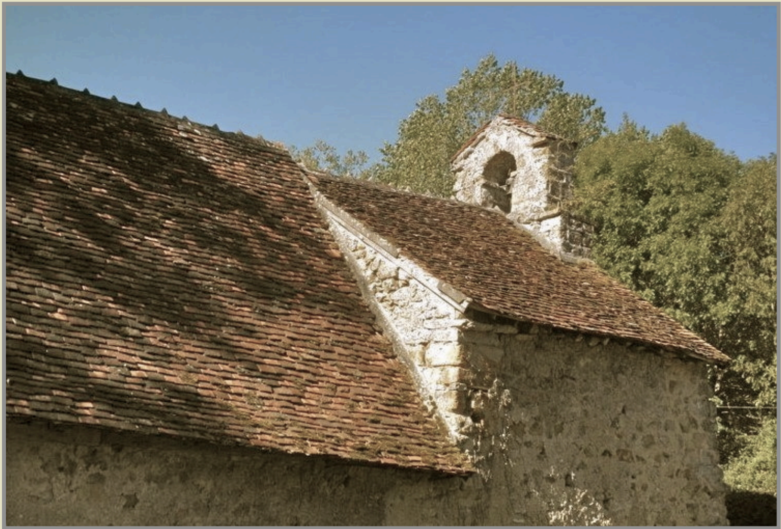
La chapelle et un des bâtiments destinés à l'hébergement des malades.