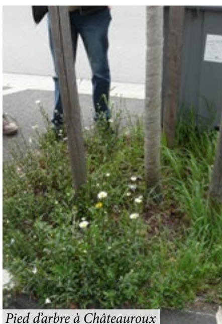
Pied d'arbre à Châteauroux

Les efforts conjugués des services « espaces verts » et « voirie » permettent désormais de traiter exclusivement les terrains sportifs. La ville poursuivra ces travaux de végétalisation et de fleurissement en pied d'arbre sur les boulevards en 2017 et 2018 en recourant à des plantes vivaces ornementales. Dans le cadre d'une gestion différenciée, le classement de certains espaces verts sera revu afin de préserver la fonctionnalité des sites tout en réduisant la charge d'entretien. Enfin, dans les cimetières