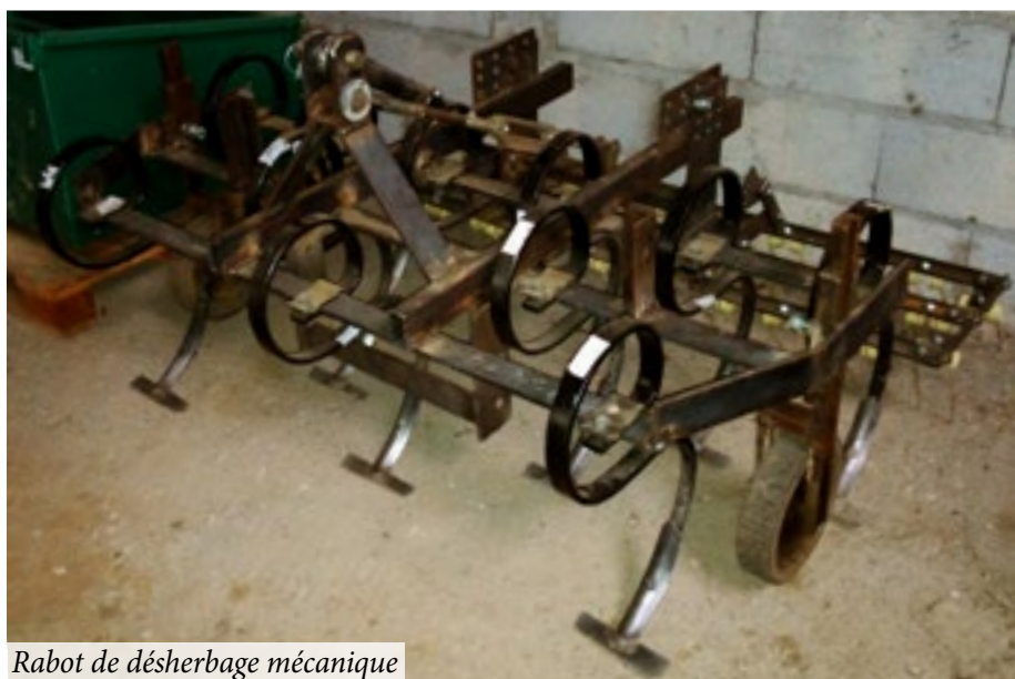
Rabet de désherbage mécanique

Dans quelques communes, on constate effectivement que des agents « bricoleurs » n'ont pas hésité à user de leur savoir-faire pour fabriquer, en régie,