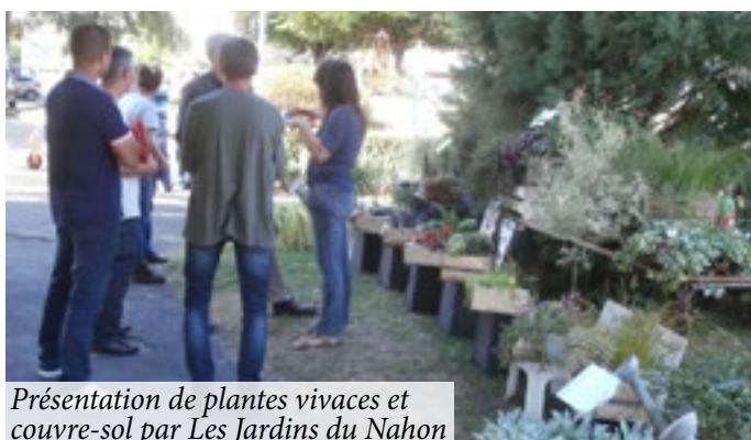
Présentation de plantes vivaces et couvre-sol par Les Jardins du Nahon