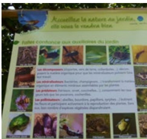
Exposition « Jardinons au naturel »

Toutes ces questions sont abordées dans ces panneaux illustrés et accessibles à tous. Les alternatives sont déclinées sur plusieurs panneaux avec le paillage, les techniques de végétalisation, les solutions pour désherber sans produit chimique ainsi que les astuces pour les jardiniers.