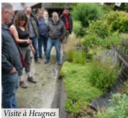
Visite à Heugnes

apposés dans le but de permettre aux particuliers et visiteurs d'en savoir plus sur les différentes espèces végétales présentes et leurs principales caractéristiques.