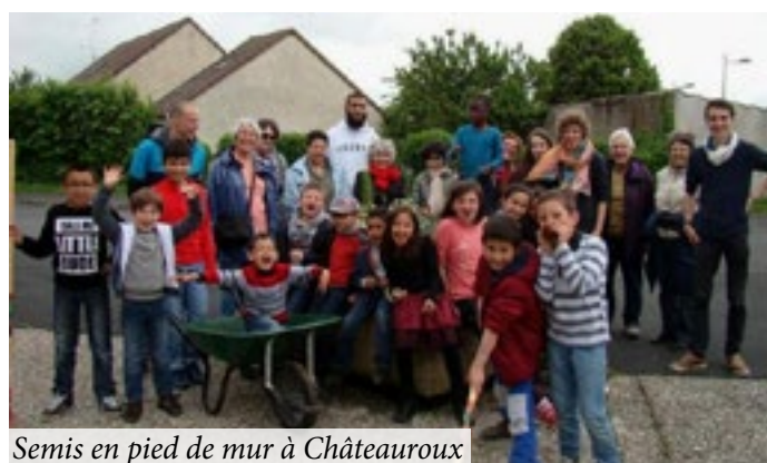
Semis en pied de mur à Châteauroux