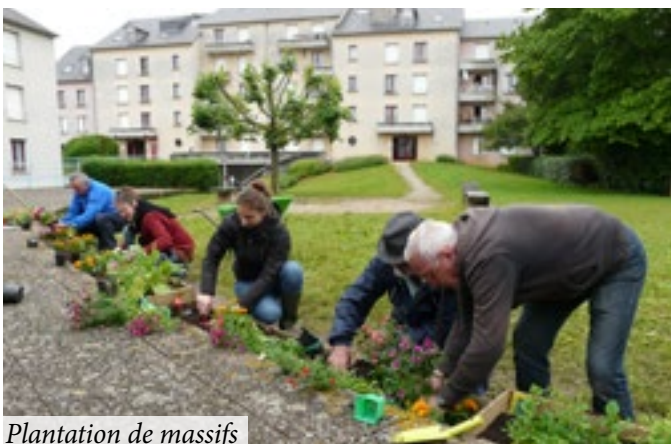
Plantation de massifs