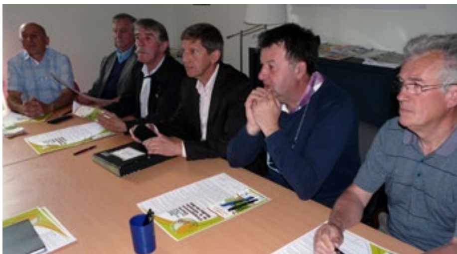
Signature de la charte OZP par 5 communes du Pays Castelroussin Val de l'Indre

Les communes de Saint-Lactencin, Neuillay-les-Bois, Sougé, Arthon et Coings ont signé la charte OZP le 6 juin 2016. Sur le Pays Castelroussin Val de l'Indre, 3 communes sont actuellement au zéro pesticide : Buzançais, Villedieu-Sur-Indre et Saint-Lactencin, cette dernière faisant partie du lot de 5 communes engagées en 2016.