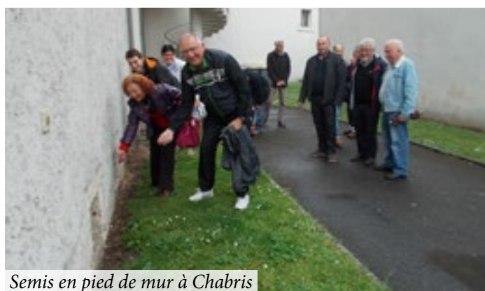
Semis en pied de mur à Chabris