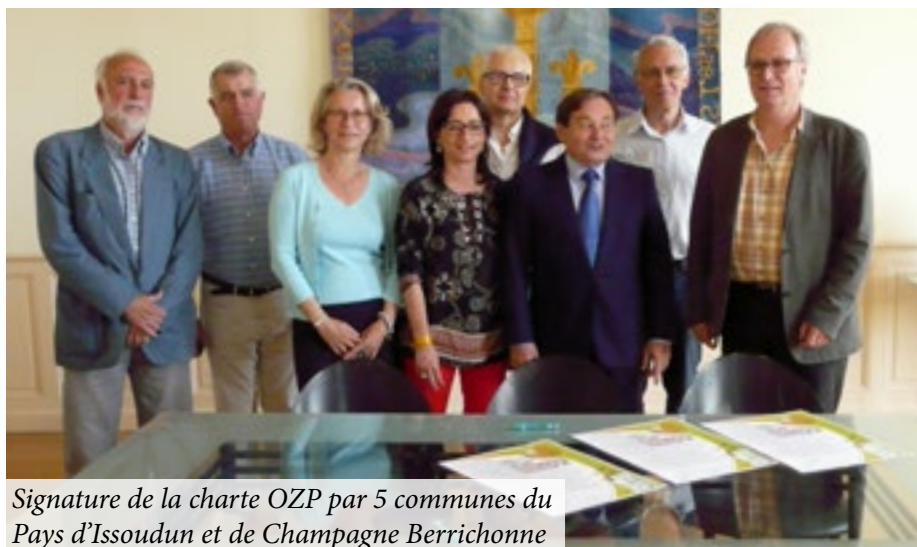
Signature de la charte OZP par 5 communes du Pays d'Issoudun et de Champagne Berrichonne

Les communes de Vatan, Lizeray, Sainte-Lizaigne, Reuilly et Bommiers ont signé la charte OZP le 8 juillet 2016. Parmi ces communes, Vatan et Reuilly n'utilisent plus de pesticide et rejoignent donc Saint-Florentin.