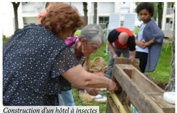
Construction d'un hôtel à insectes