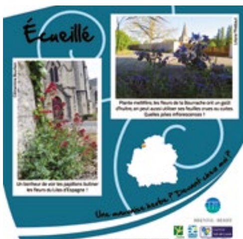
Panneau sur la ville d'Écueillé de l'exposition « Une mauvaise herbe ? Devant chez moi ? ».

Que ce soit sur la composition de son sol, sur les insectes alliés du jardinier ou sur l'entretien de sa pelouse, cette exposition regorge d'idées. Elles sont toutes bonnes à prendre et à essayer chez soi ! Saviez-vous par exemple que les engrais verts permettent de limiter la pousse des herbes indésirables tout en enrichissant le sol en éléments nutritifs pour les cultures à venir ?