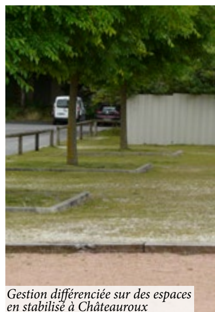
Gestion différenciée sur des espaces en stabilisé à Châteauroux

entretenus sans pesticide, le revêtement bitumé des allées principales sera refait à neuf