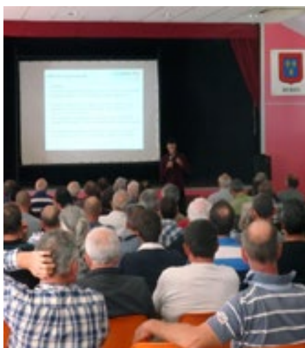
Intervention de FNE Centre-Val de Loire sur la législation autour de l'usage des pesticides

Après Ecueillé en 2015, ce fut au tour de Villedieu-Sur-Indre d'accueillir le forum annuel départemental autour des alternatives aux pesticides. Plus de 60 communes de l'Indre ont participé à cet événement représentant environ 130 personnes.