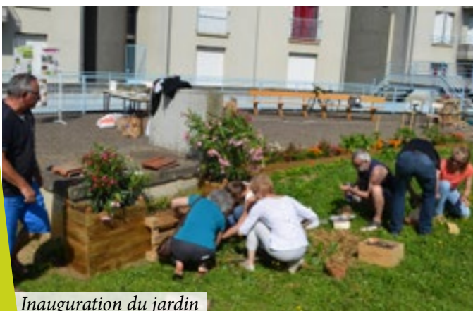
Inauguration du jardin