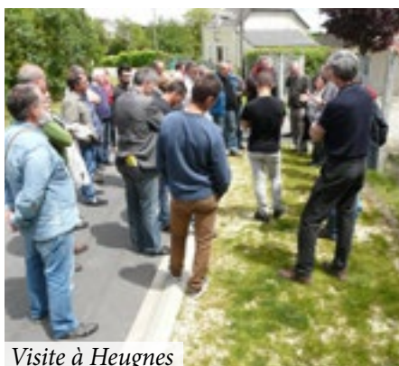
Visite à Heugnes