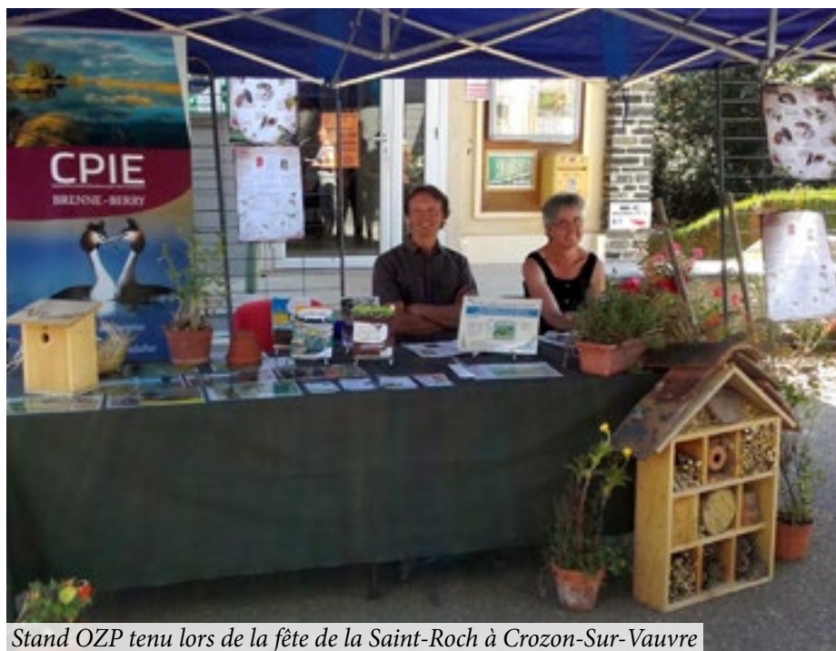
Stand OZP tenu lors de la fête de la Saint-Roch à Crozon-Sur-Vauvre

La présence de visages familiers sur le stand incite les riverains à venir le découvrir. Crozon-sur-Vauvre a réussi à atteindre le zéro pesticide et les retours des habitants ont été très positifs à l'occasion de cette journée de sensibilisation !