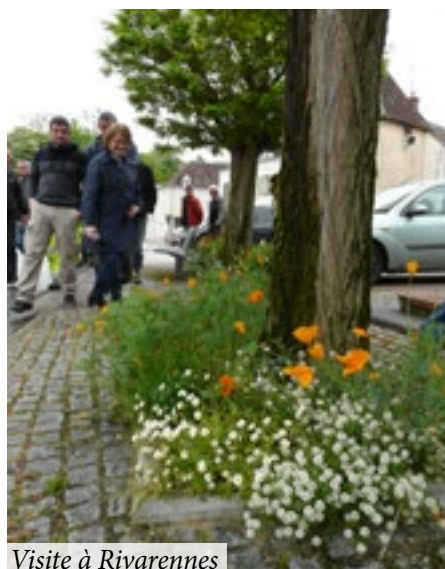
Visite à Rivarennes

Le CPIE Brenne-Berry et Indre Nature organisent chaque année des visites techniques au sein de communes ayant expérimenté des techniques alternatives intéressantes.