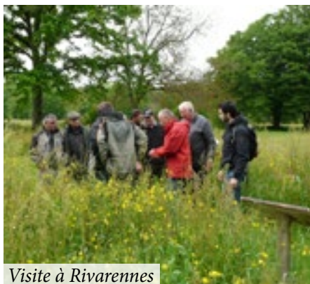
Visite à Rivarennas

Le premier groupe d'agents et élus présents ont été guidés à travers le bourg de Rivarennas où ils ont notamment pu observer les nombreux semis de mélanges de fleurs en pieds d'arbres et pieds de mur évitant ainsi tout désherbage sur ces zones difficiles. Certains riverains se sont même pris au jeu puisqu'ils entretiennent et sèment à leur tour des fleurs devant chez eux. Au niveau du cimetière, il a été possible d'observer le test d'engazonnement, ainsi que le projet futur d'engazonner l'ensemble du cimetière avec un gazon spécifique afin de faciliter son entretien. Pendant ce temps, le second groupe d'agents et élus a pu découvrir la flore spontanée qui se développe sur l'espace des Sécherins à Rivarennas et où des panneaux pédagogiques ont été