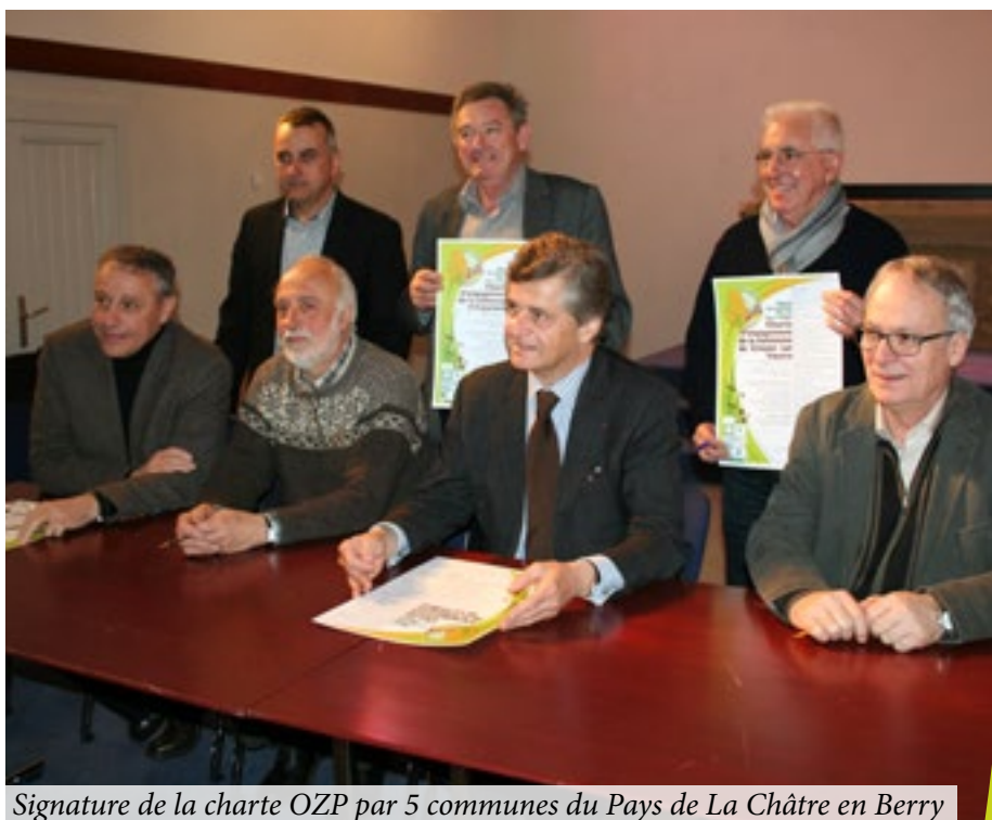
Signature de la charte OZP par 5 communes du Pays de La Châtre en Berry

Les communes de Neuvy-Saint-Sépulchre, Crozon-Sur-Vauvre, Sainte-Sévère-Sur-Indre, Aigurande et La Châtre ont signé la charte OZP le 14 mars 2016. La commune de Crozon-sur-Vauvre a déjà rejoint Le Magny concernant l'arrêt de l'utilisation des pesticides grâce, notamment, à une implication forte des agents aussi bien dans la conception de matériel d'entretien alternatif (à l'image du rabet de désherbage fabriqué au sein de la commune) que dans le volet pédagogique et la communication envers les administrés.