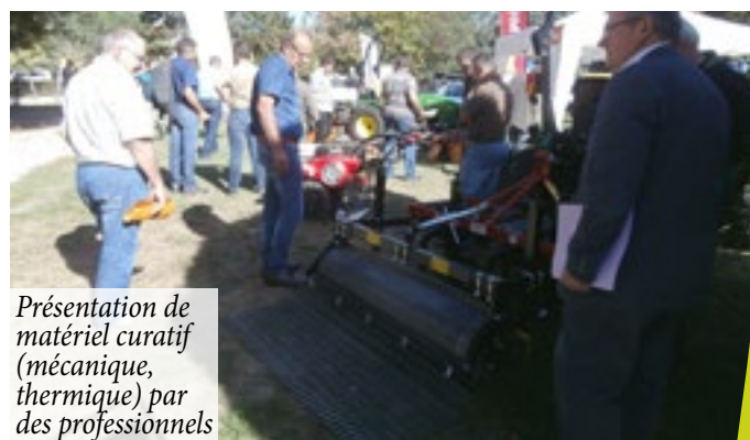
Présentation de matériel curatif (mécanique, thermique) par des professionnels