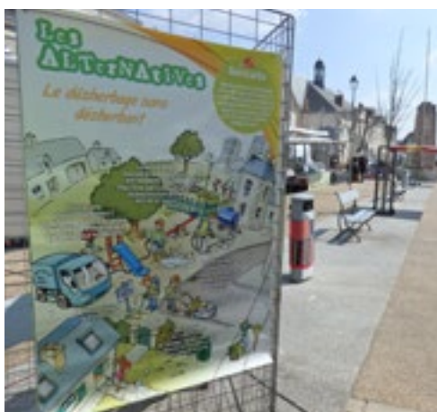
Exposition « Zéro Pesticide » au marché du Blanc.

Trois expositions sont proposées par le CPIE Brenne-Berry sur le zéro pesticide, sur le jardinage au naturel et sur les herbes folles. N'hésitez pas à les demander pour vos événements !